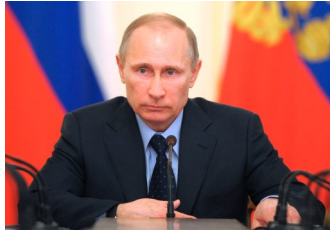
Президент Р.Ф. В.В.Путин

2023 год Указом Президента России Владимира Путина объявлен Годом педагога и наставника. Миссия Года – признание особого статуса педагогических работников, в том числе выполняющих наставническую деятельность. Мероприятия Года педагога и наставника будут направлены на повышение престижа профессии учителя.