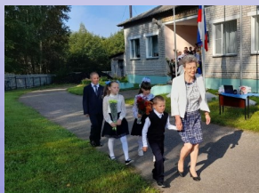
Классный руководитель 1, 3 класса со своими учениками